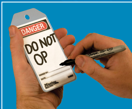
Gereinigter Anhänger bereit für die nächste Nachricht: Sie die neue Nachricht mit Permanentstift