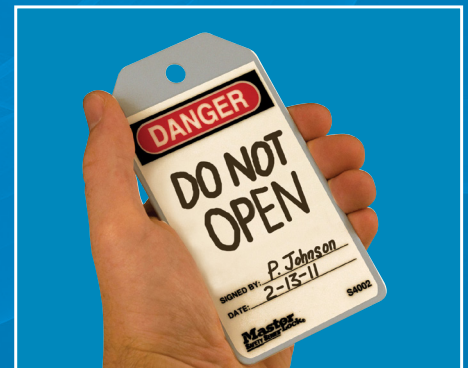
Eine brandneue Mitteilung für das nächste Projekt