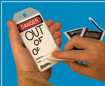
Vorhandene Nachricht mit Isopropanol abwischen